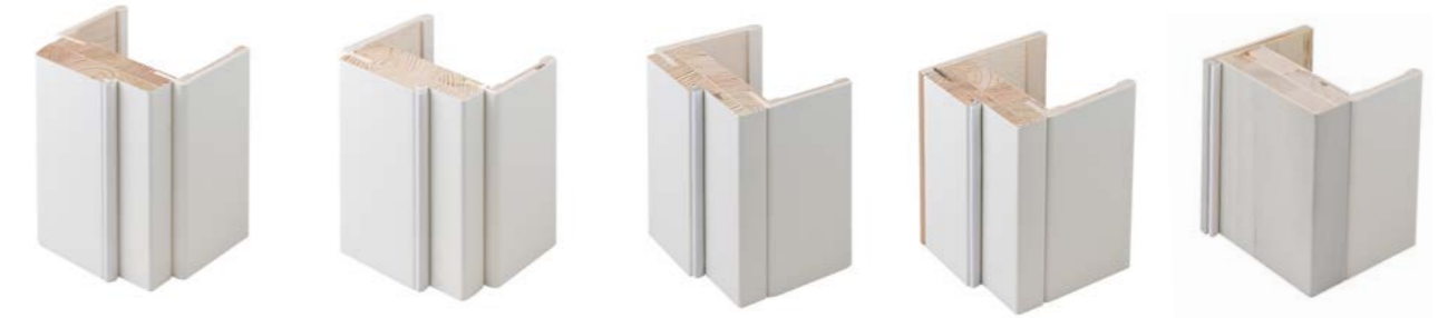
DINAMIKA DI SERIE STANDARD STANDARD ESTÁNDAR